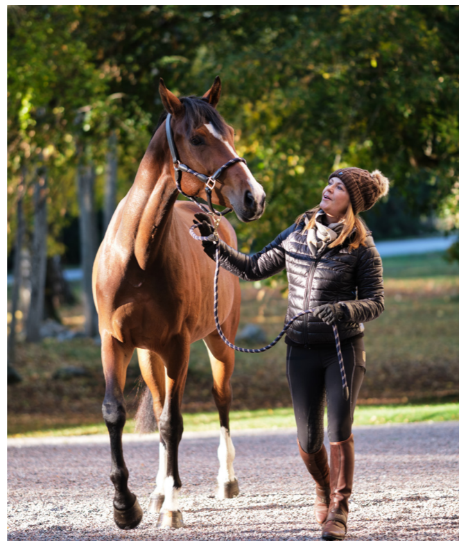
Att åka till stallet en helgmorgon eller på vägen hem från jobbet är ett fantastiskt sätt att koppla bort allt annat för en stund.