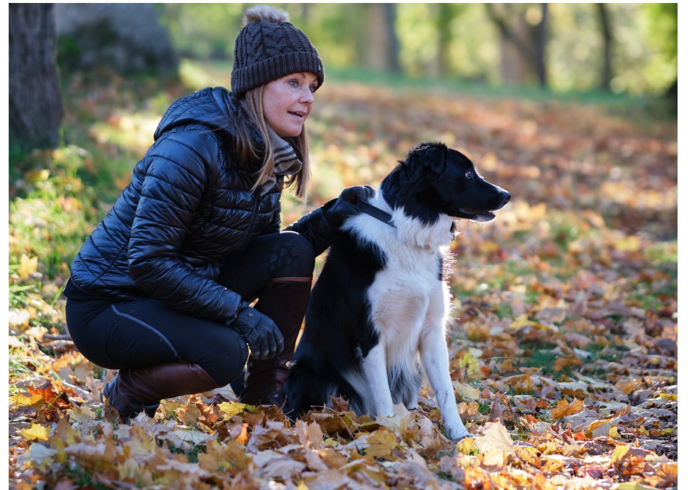
Bosse, vår border collie, är min bästa Vaxholms-guide. Jag tror att han har visat mig varenda stig och vartenda gathörn.

macken och ta en kaffe med sig på vägen till jobbet. Åker jag inte bil tar jag bussen som går hela tiden och är i T-banan vid Danderyds sjukhus på en halvtimme. Ska jag ända in till City på morgonen tar jag pendelbåten från bryggan närmast där jag bor, dricker kaffe och läser tidningen på båten medan Stockholms skärgård passerar förbi utanför fönstret, eller sitter på fördäck om det är fint väder, och landar utanför Grand Hotel efter en timme.